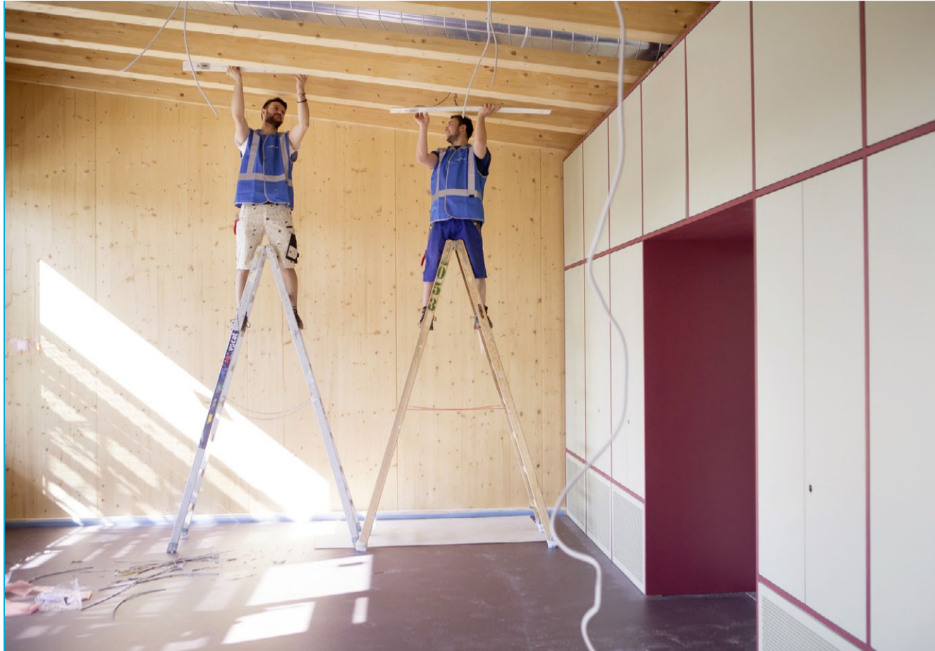
Grosszügige Fensterfronten sorgen in jedem Raum für Tageslicht: Enderbeiten am Aemtler D.

Dreh- und Angelpunkt des neuen Betreuungsgebäudes ist das offene Atrium, das alle drei Etagen im Inneren miteinander verbindet. Durch ein Oberlicht gelangt auch hier Tageslicht bis ins Erdgeschoss. Im obersten Stockwerk leiten Glasziegel das Licht seitlich in die Gänge. Um diesen Innenhof herum sind die Betreuungs- und Esszimmer sowie die beiden neuen Kindergärten angeordnet, die ab kommendem Schuljahr in diesem Bereich der Schulanlage Aemtler betrieben werden. Die Kindergärten verfügen über eigene Zugänge und einen